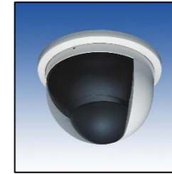
動体検知パッシブセンサー付きドーム型カメラ

センサー付きの防犯カメラを設置すれば、倉庫に人が近づいた時だけを録画できます。24時間カメラで録画をすると後でチェックが大変ですよ。在庫に人が近づいた時だけ録画をするので、欲しい映像だけが高画質で取得できます。屋外・屋内どちらにも設置可能です。