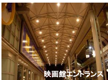
映画館エントランス