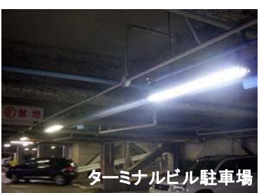
ターミナルビル駐車場