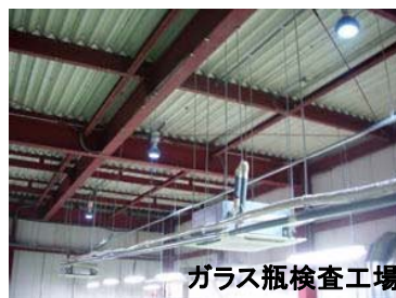
ガラス瓶検査工場