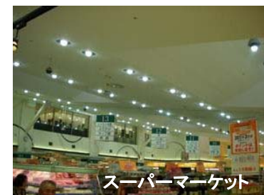
スーパーマーケット