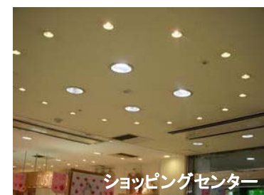
ショッピングセンター